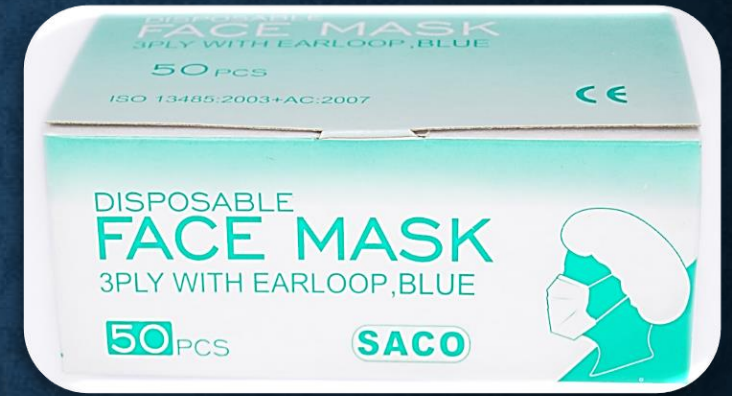
MASCARILLA BUCONASAL 04-FR-13170 7453006076389