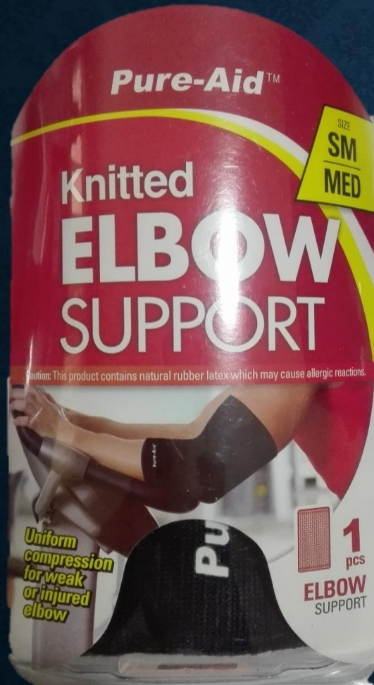
SOPORTE DE CODO 856023002640