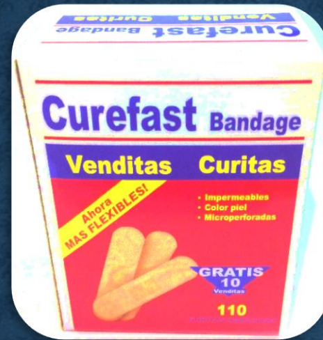
CURITAS/CUREFAST 7A019-BL-110 7453038406703