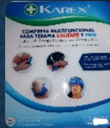
COMPRESA MULTIFUNCIONAL/ KAREX A414-YK1317 7453078547435