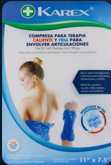
COMPRESAS PARA ARTICULACIONES/ KAREX A414-YK2038 7453078547411