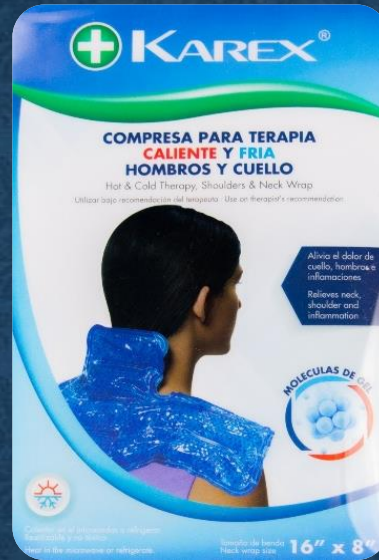
COMPRESAS PARA CUELLO/ KAREX A414-YK0306 7453078547404