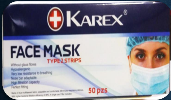
FACE MASK/ BUCONASAL A414-3PW01 7453038431668