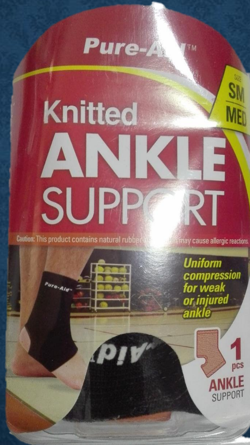
SOPORTE DE TOBILLO 856023002664