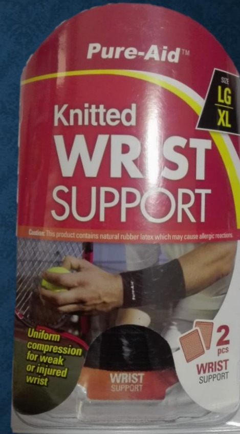
SOPORTE DE MUÑECA 856023002619